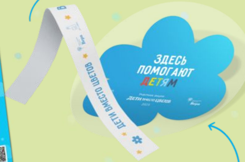
лента для букета